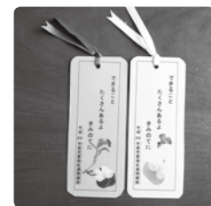
新 1 年生へのプレゼントのしおり作り。 子どもたちの様子を話しながら、楽しく作業を進めます。