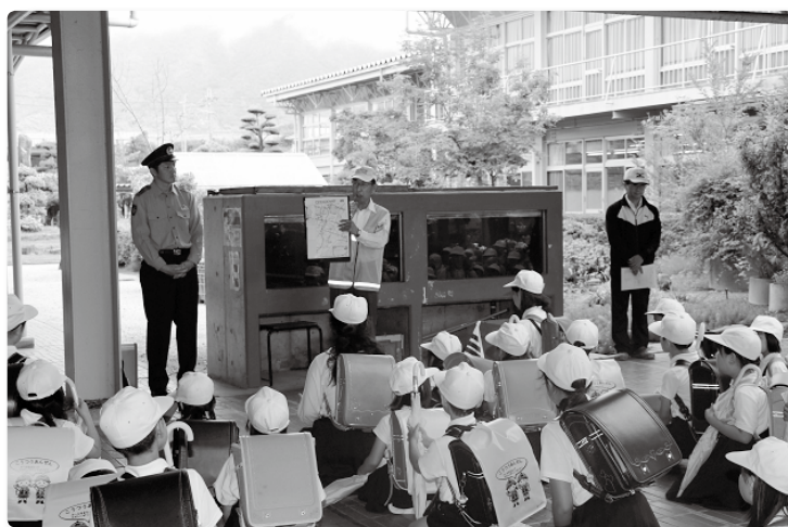
安全マップの説明

開催にあたり、子どもたちは自治会通学班ごとに整列し、取り組み内容を確認したのち下校となりますが、それぞれの地域ごとに通学路を歩きながら注意が必要な箇所を入念にチェックするとともに、子どもから危険な箇所を聞き取ります。また、不審者の情報の周知・共有を図って、知らない人にはついていかないこと、通学路以外の人目につかない場所には立ち寄らないこと等呼びかけています。