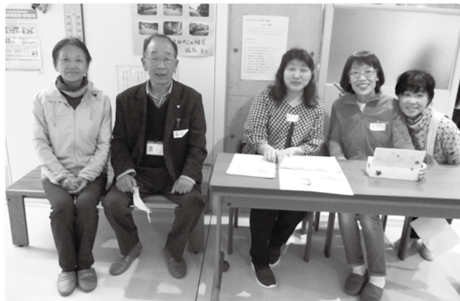
「てんびんの里 みなみ」の運営を支える 五個荘地区民児協の皆さん