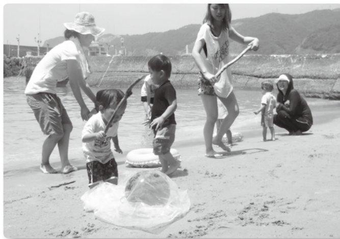
海遊びの様子。すいかわりを楽しみました。

児童委員活動を進めるなかで、さまざまな出会いがありました。子育て、子育てを応援できることが、私たちのモチベーションにつながっています。