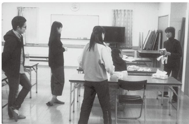
和やかな雰囲気の“おやつタイム”。子どもたちとの何気ないおしゃべりからコミュニケーションが深まります。

また、教職に就くことになった学習支援ボランティアの学生は、「教育実習で子どもたちに教えることに自信を失いかけていましたが、寺子屋の生徒たちの真摯に学ぶ姿勢にふれることで、自信を取り戻すことができました」と話してくれました。今後も子どもたちが生き生きと暮らしていけるように、地域全体で支えていきたいと思っています。