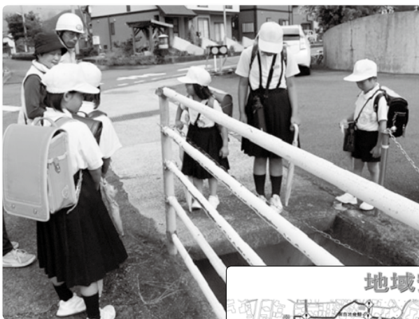
危険箇所の点検の様子

3年ごとに改訂する「地域安全マップ」については見直しを行い、地域の方がたとともに安心・安全な町づくりをめざして、取り組んでいます。