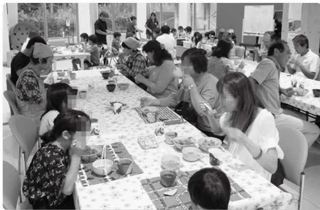
子どもや保護者など、 毎回40名近くの参加者でにぎわう 「てんびんの里 みなみ」の様子

社会福祉法人には、「地域における公益的な取組」を行う責務があります。しかし、地域住民の個別具体のニーズまで把握することは難しく、そんな時に地域住民に寄り添った活動を日々行っている民生委員の情報は頼りになります。逆に、社会福祉法人は、福祉の専門職が集まる場でもありますので、民生委員からも安心して、相談をしてもらう関係をつくっていきたいと思います。