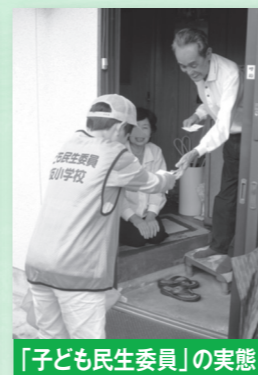
「子ども民生委員」の実態