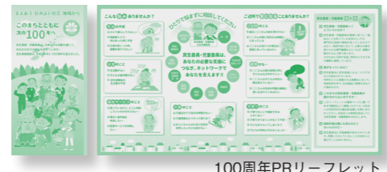
100周年PRリーフレット

※ PRカード (3つ折りの名刺型) 民生委員・児童委員の性格、役割や守秘義務、相談内容の例示などを紹介。訪問時の名刺代わりや留守宅へのメッセージカードとして、またポケットティッシュに入れての配布にご活用いただけます。