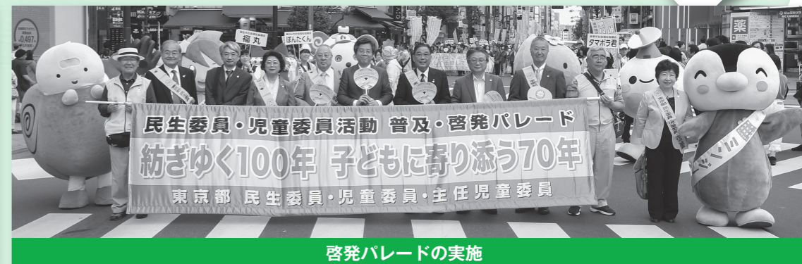
啓発パレードの実施